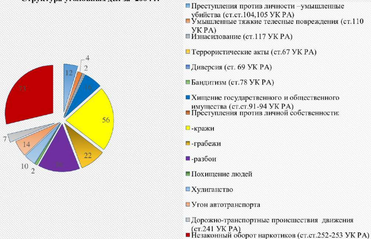
Структура уголовных дел за 2004 г.